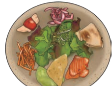
PLATILLO PLATE 前菜盛り合わせ