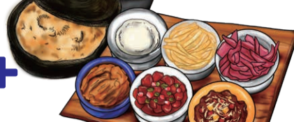
MAIN DISH 選べるメインディッシュ