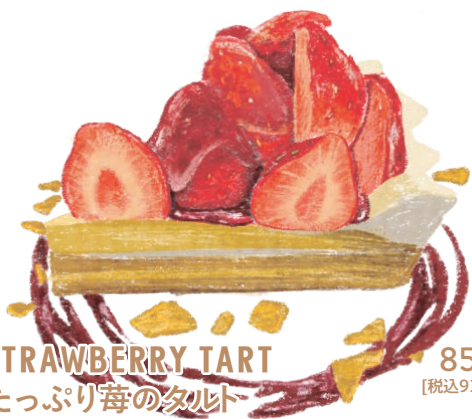
STRAWBERRY TART たっぷり苺のタルト