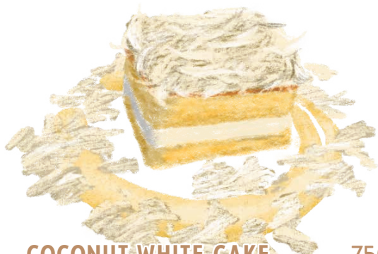
COCONUT WHITE CAKE ココナッツ・ホワイトケーキ