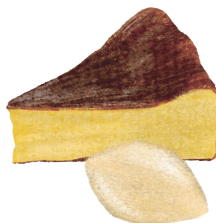
BASQUE CHEESE CAKE with whipped cream バスクチーズケーキ