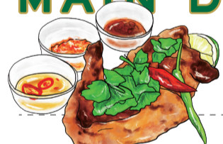
GAI YAANG - thai roasted chicken 2200 [税込2420] みちのく清流鶏のガイヤーン [1/2羽] - 絶品! 骨付きモモ肉のタイ・ローストチキン

NUA YAANG - thai rib eye steak 3500 [税込3850] 士幌黒牛のリップロースのタイ風ステーキ ヌアヤーン 牛肉を香ばしくグリル、アジア仕立ての薄切りステーキで!