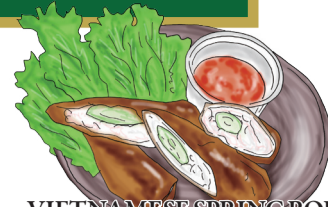
VIETNAMESE SPRING ROLL ベトナム風揚げ春巻き ライスペーパーを使ったベトナム風揚げ春巻き。 たっぷりのハーブをサニーレタスで 包んでスクチャムソースで! 1000 [税込1100]