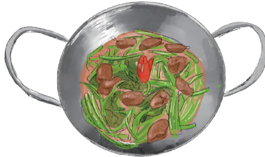
STIR FRIED GREEN VEGETABLES & GIZZARD ベトナム風・青菜と砂肝炒め 1000 [税込1100]