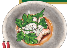
YODARE-DORI Cold Steamed Chicken with Spicy Leek Oil Sauce よだれ鶏の葱油ソース 辛さと香りがきたピリ辛ダレ 900 [税込990]