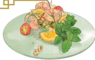
YAM THALE spicy seafood salad ヤムタレー 海老と野菜の スパイシーサラダ 950 [税込1045]