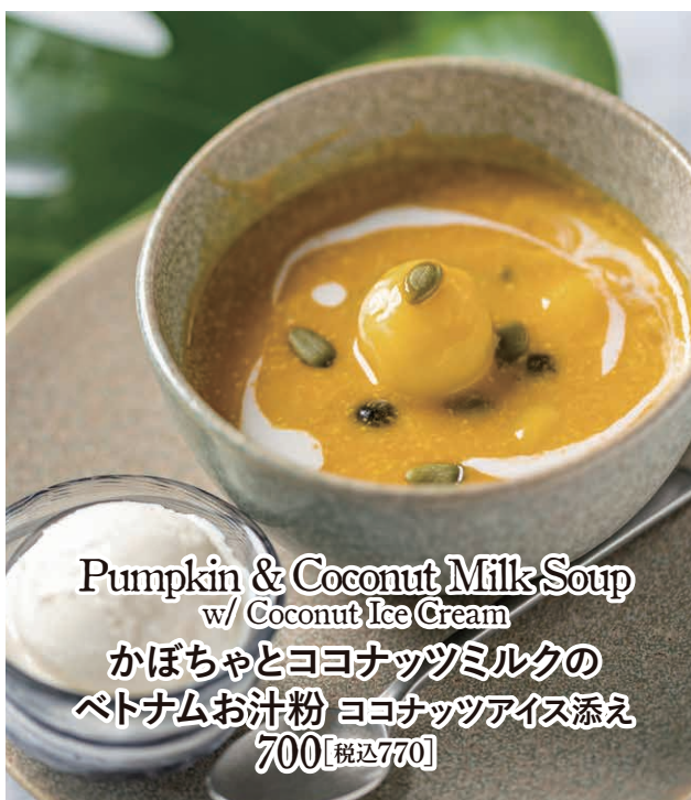
Pumpkin & Coconut Milk Soup w/ Coconut Ice Cream かぼちゃとココナッツミルクの ベトナムお汁粉 ココナッツアイス添え 700【税込770】