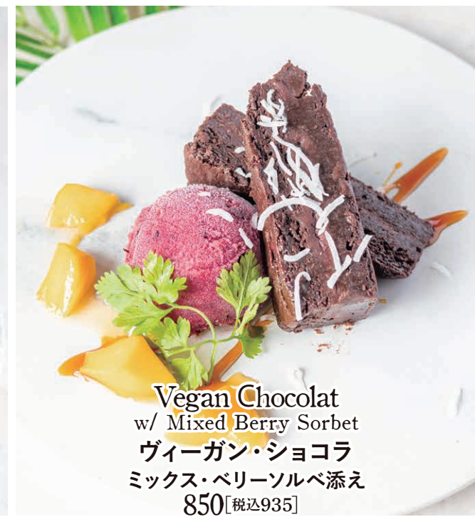
Vegan Chocolat w/ Mixed Berry Sorbet ヴィーガン・ショコラ ミックス・ベリーソルベ添え 850【税込935】