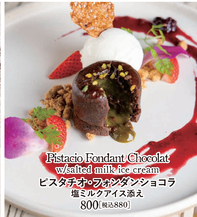
Pistacio Fondant Chocolat w/salted milk ice cream ピスタチオ・フォンダンショコラ 塩ミルクアイス添え 800【税込880】