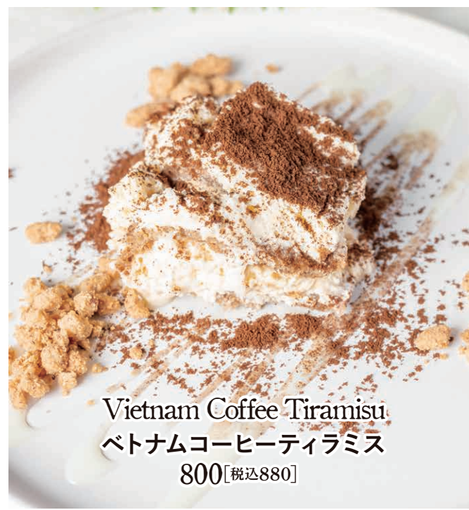
Vietnam Coffee Tiramisu ベトナムコーヒーティラミス 800【税込880】