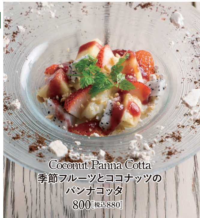
Coconut Panna Cotta 季節フルーツとココナッツの パンナコッタ 800【税込880】