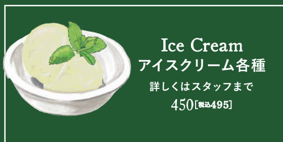
Ice Cream アイスクリーム各種 詳しくはスタッフまで 450【税込495】

Lemongrass Ginger Tea | HOT or ICED | 600 レモングラスジンジャー・ハーブティー 【税込660】