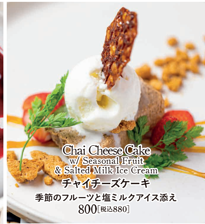
Chai Cheese Cake w/ Seasonal Fruit & Salted Milk Ice Cream チャイチーズケーキ 季節のフルーツと塩ミルクアイス添え 800【税込880】