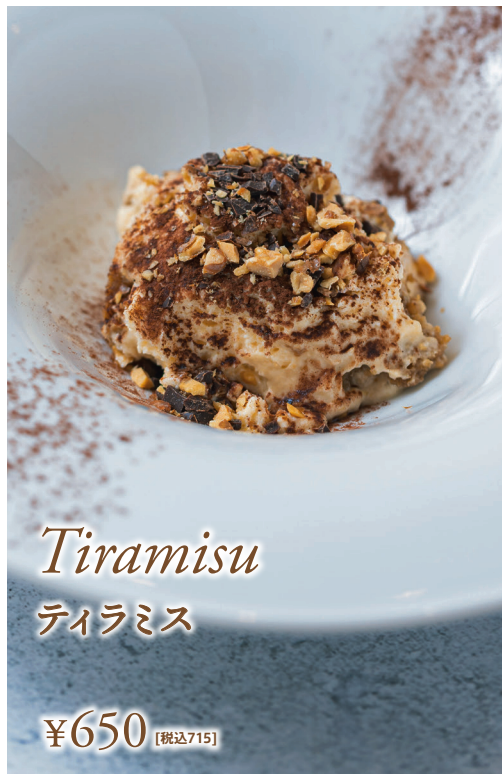
Tiramisu ティラミス ¥650 [税込715]