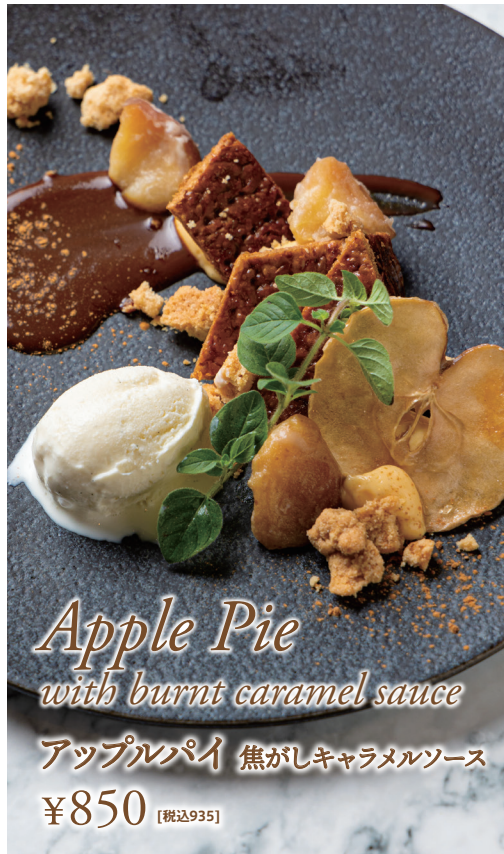
Apple Pie with burnt caramel sauce アップルパイ 焦がしキャラメルソース ¥850 [税込935]