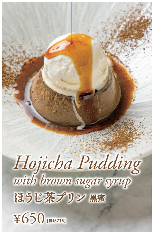
Hojicha Pudding with brown sugar syrup ほうじ茶プリン 黒蜜 ¥650 [税込715]