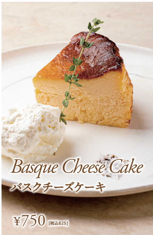
Basque Cheese Cake バスクチーズケーキ ¥750 [税込825]