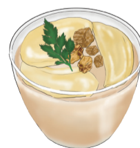
PANNA COTTA パンナコッタ