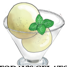
TODAY'S GELATO 本日のジェラート 詳しくはスタッフまで