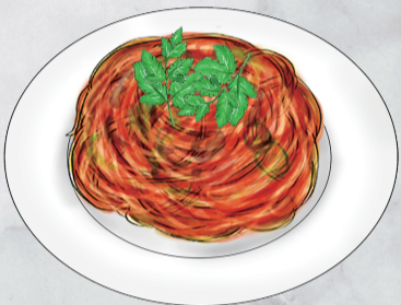
MAIN DISH メインディッシュ メイン・ピッツァ・パスタより 1品お選びください。