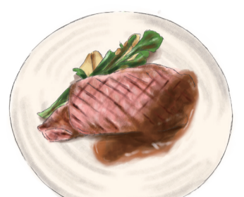
GRILLED AKAUSHI BEEF 高知県産 あかうしのステーキ オニオンソース 100g +¥935 / 200g +¥1650