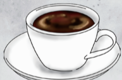
DRINK ドリンク 右側より1品お選びください。