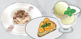
DESSERT 選べるデザート 右側より1品お選びください。