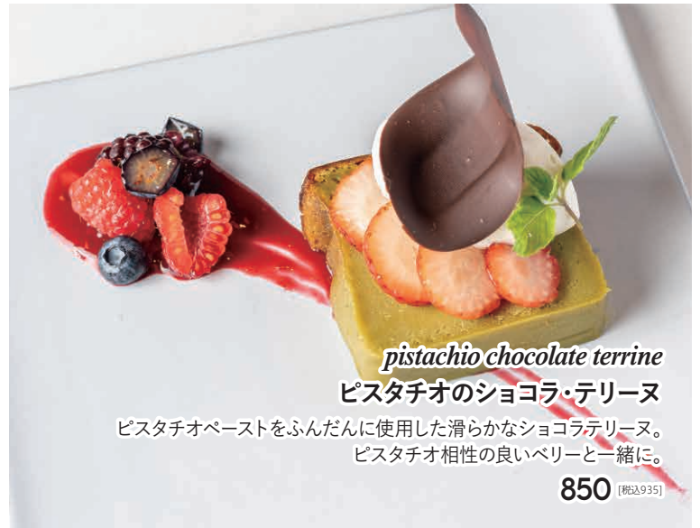
pistachio chocolate terrine ピスタチオのショコラ・テリーヌ ピスタチオペーストをふんだんに使用した滑らかなショコラテリーヌ。 ピスタチオ相性の良いベリーと一緒に。 850 [税込935]