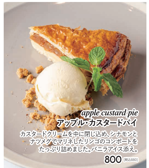
apple custard pie アップル・カスタードパイ カスタードクリームを中に閉じ込め、シナモンと ナツメグでマリネしたリンゴのコンポートを たっぷり詰めました。バニラアイス添え。 800 [税込880]