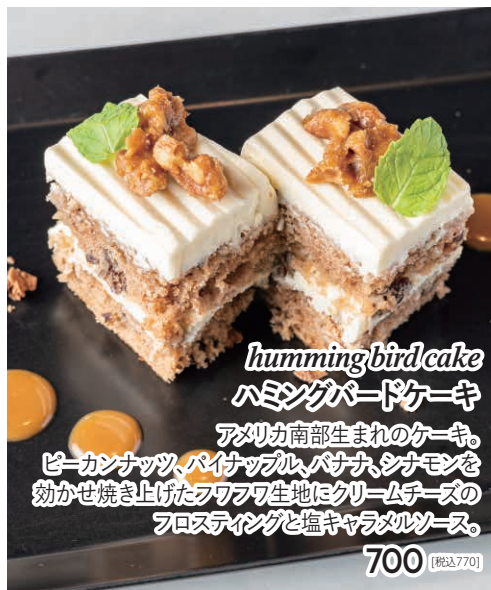
hummingbird cake ハミングバードケーキ アメリカ南部生まれのケーキ。 ピーカンナッツ、パイナップル、バナナ、シナモンを 効かせ焼き上げたフワフワ生地はクリームチーズの フロスティングと塩キャラメルソース。 700 [税込770]