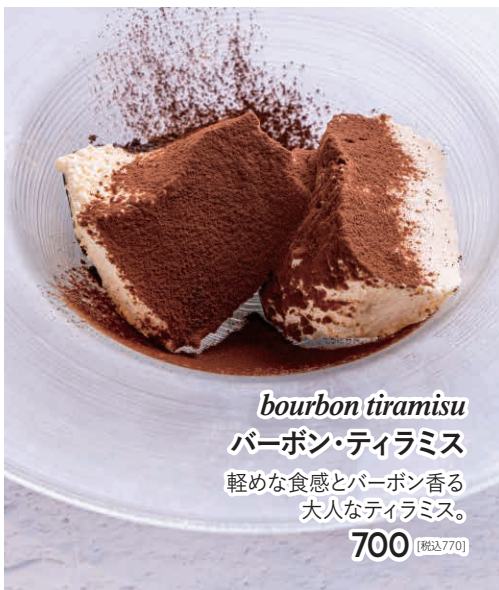
bourbon tiramisu バーボン・ティラミス 軽めな食感とバーボン香る 大人なティラミス。 700 [税込770]