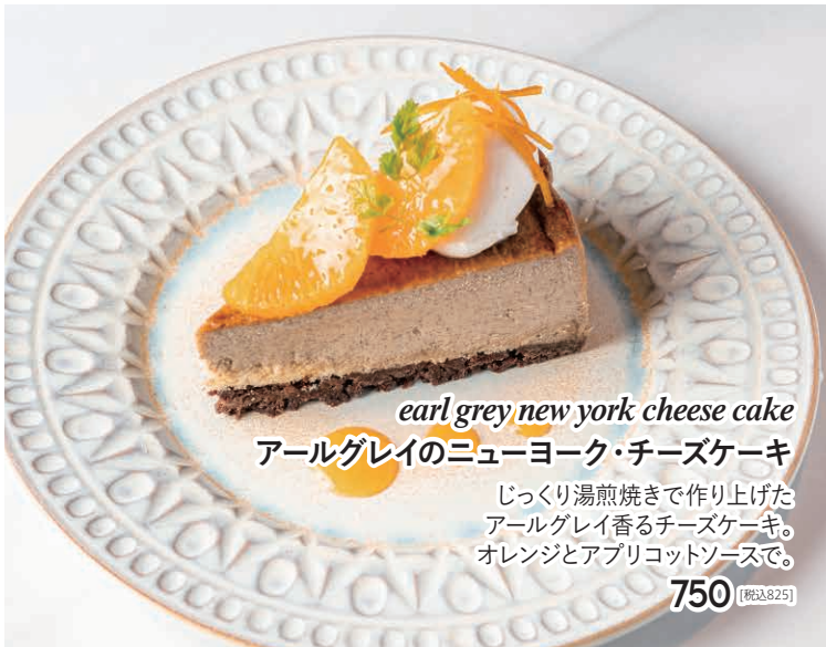
earl grey new york cheese cake アールグレイのニューヨーク・チーズケーキ じっくり湯煎焼きで作り上げた アールグレイ香るチーズケーキ。 オレンジとアプリコットソースで。 750 [税込825]