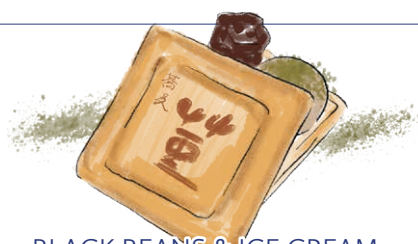
BLACK BEANS & ICE CREAM SANDWICH "MONAKA"