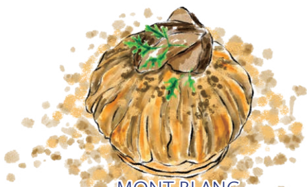
MONT BLANC 和栗の茶巾モンブラン