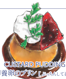
CUSTARD PUDDING 那須御養卵のプリン【ぷっちゃんして召し上がれ】