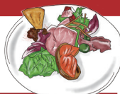
APPETIZER MISTO 前菜盛り合わせ

メインディッシュはお好きなものをチョイス! [税込 2640] コース仕立ての“ニューアメリカン料理”が堪能できるランチコース