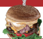
MAIN DISH メインディッシュ お好きな1品