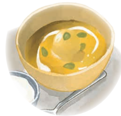
Pumpkin & Coconut Milk Soup w/ Coconut Ice Cream かぼちゃとココナッツミルクのベトナムお汁粉 - ココナッツアイス添え