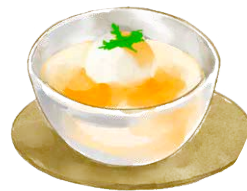
Mango & Coconut Milk Che マンゴーとココナッツミルクのチェー