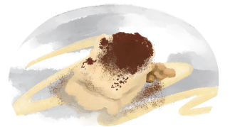
Vietnam Coffee Tiramisu ベトナムコーヒー・ティラミス