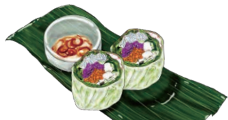
SUMMER ROLL 生春巻き“ゴイクン”