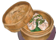
DIM-SUM 本日のディムサム