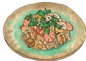
MAIN DISH 選べるメインディッシュ [右記よりお選びください]