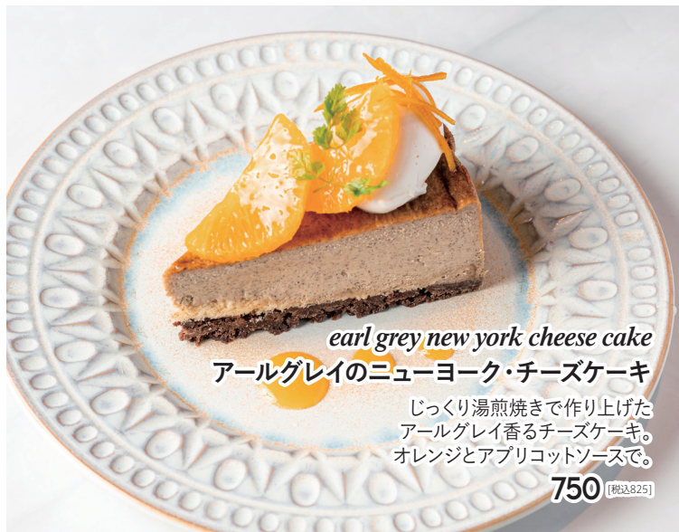
earl grey new york cheese cake アールグレイのニューヨーク・チーズケーキ じっくり湯煎焼きで作り上げた アールグレイ香るチーズケーキ。 オレンジとアプリコットソースで。 750 [税込825]