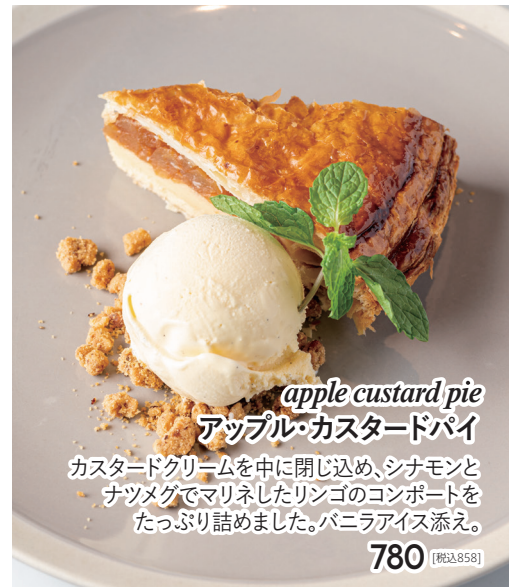
apple custard pie アップル・カスタードパイ カスタードクリームを中に閉じ込め、シナモンと ナツメグでマリネしたリンゴのコンポートを たっぷり詰めました。バニラアイス添え。 780 [税込858]