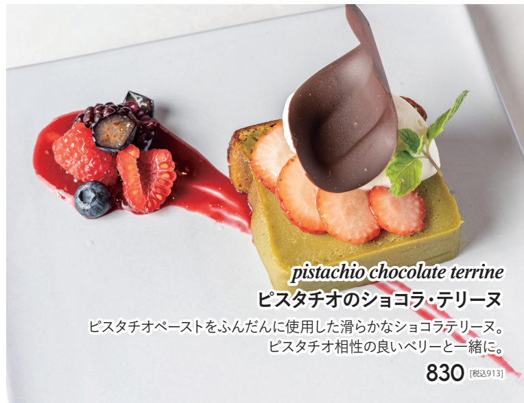
pistachio chocolate terrine ピスタチオのショコラ・テリーヌ ピスタチオペーストをふんだんに使用した滑らかなショコラテリーヌ。 ピスタチオ相性の良いベリーと一緒に。 830 [税込913]