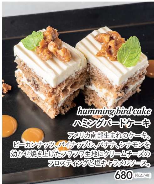
hummingbird cake ハミングバードケーキ アメリカ南部生まれのケーキ。 ピーカンナッツ、パイナップル、バナナ、シナモンを 効かせ焼き上げたフワフワ生地はクリームチーズの フロスティングと塩キャラメルソース。 680 [税込748]