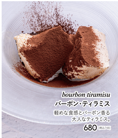
bourbon tiramisu バーボン・ティラミス 軽めな食感とバーボン香る 大人なティラミス。 680 [税込748]