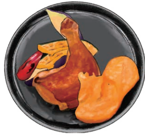
CHICKEN CONFIT w/ Salsa Romesco 奥の都どりのコンフィ 焼きパプリカとナッツのロメスコソース