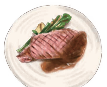
GRILLED AKAUSHI BEEF 高知県産 あかうしのステーキ オニオンソース 100g +¥935 / 200g +¥1650