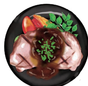
GRILLED HAKKINTON PORK 白金豚 肩ロース肉のグリル ジンジャーソース