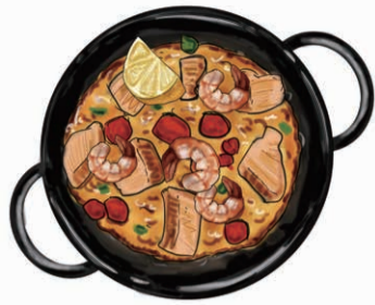
HAKKINTON PORK & SHRIMP PAELLA 白金豚・肩ロースと 小海老のパエリア

Choose one main dish from the list below. 下記より、メインの料理を一つお選びください。