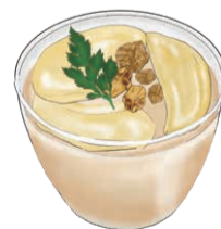
PANNA COTTA パンナコッタ