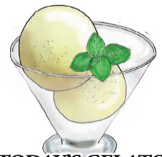
TODAY'S GELATO 本日のジェラート 詳しくはスタッフまで