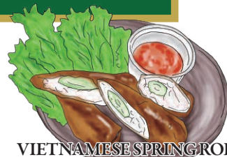
VIETNAMESE SPRING ROLL ベトナム風揚げ春巻き ライスペーパーを使ったベトナム風揚げ春巻き。 たっぷりのハーブをサニーレタスで 包んでヌクチャムソースで! 990 [税込1089]