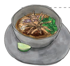
KHAO SOI Thai Curry Noodle | タイ | 細中華そば | 1260 [税込1386] タイ北部・カレーヌードル カオソーイ スパイスの効いたカレースープに中華麺と揚げ麺を入れたタイ北部のカレーヌードル

PHO GA Chicken pho | ベトナム | 米粉中太麺・フォー | 1260 [税込1386] フォー・ガー - 鶏肉のフォー フォーの定番!クリアなスープに香味野菜と蒸し鶏