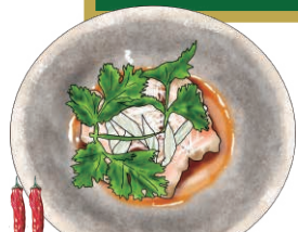
YODARE-DORI Cold Steamed Chicken with Spicy Leek Oil Sauce よだれ鶏の葱油ソース 辛さと香りがきいたピリ辛ダレ 860 [税込946]