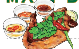
GAI YAANG - thai roasted chicken 2200 [税込2420] みちのく清流鶏のガイヤーン [1/2羽] - 絶品!骨付きモモ肉のタイ・ローストチキン

NUA YAANG - thai rib eye steak 3460 [税込3806] 士幌黒牛のリップロースのタイ風ステーキ ヌアヤーン 牛肉を香ばしくグリル、アジア仕立ての薄切りステーキで!