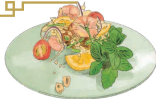
YAM THALE spicy seafood salad ヤムタレー 海老と野菜の スパイシーサラダ 940 [税込1034]