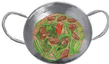
STIR FRIED GREEN VEGETABLES & GIZZARD ベトナム風・青菜と砂肝炒め 990 [税込1089]