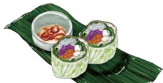
SUMMER ROLL 生春巻き“ゴイクン”