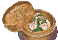
DIM SUM 本日のディムサム