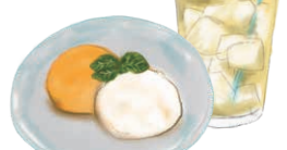
ICE CREAM & DRINK アイスクリームとドリンク