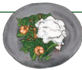
週替わりアジアランチ 詳しくはスタッフが説明いたします WEEKLY LUNCH