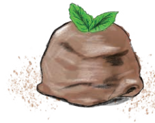
HOMEMADE CHOCOLATE ICE CREAM 自家製チョコレートアイス 630 [税込693]