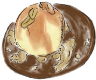
AFFOGATO アフォガート 自社焙煎所“ハンマーヘッドロースタリー”から届くコーヒー豆のエスプレッソで仕上げます 630 [税込715]