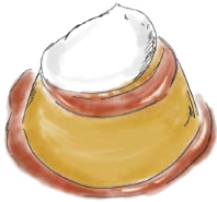
CLASSIC PUDDING クラシック・プリン 630 [税込715]