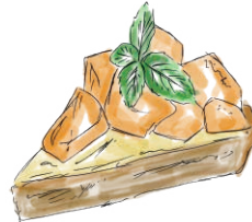
OKINAWA MANGO TARTE 沖縄マンゴータルト 880 [税込968]