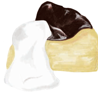
BASQUE CHEESE CAKE