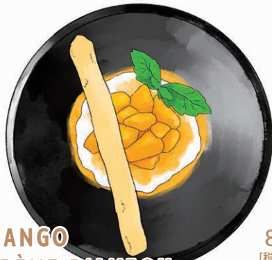
MANGO CRÈME D'ANJOU